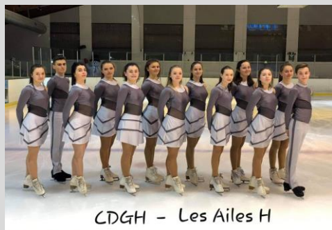
CDGH - Les Ailes H