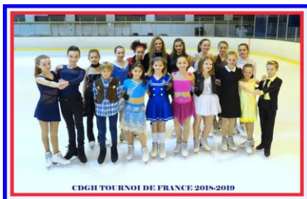
CDGH TOURNOI DE FRANCE 2018-2019

L' équipe nationale prête pour sa 3ème compétition, les 2 et 3 février à Dijon