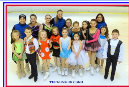
TIR 2018-2019 CDGH

L'équipe inter-régionale, de retour de sa première compétition à Angers, avec une belle seconde place au podium des clubs. Bravo!